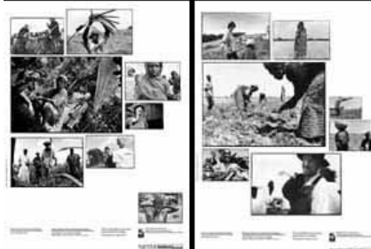
Affiches n/b 15.-