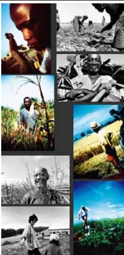
Série de 8 cartes 12.-

Exposition: D'autres lieux sont en préparation, consultez le site