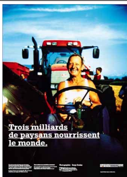
Affiche Nord 90x64cm

La rédaction des textes a demandé beaucoup de