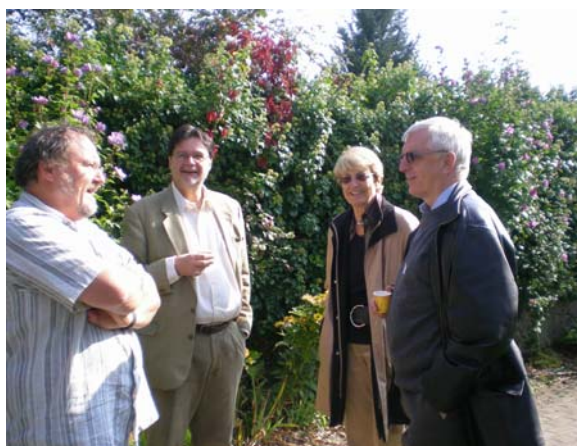
Université des Verts à Cartigny