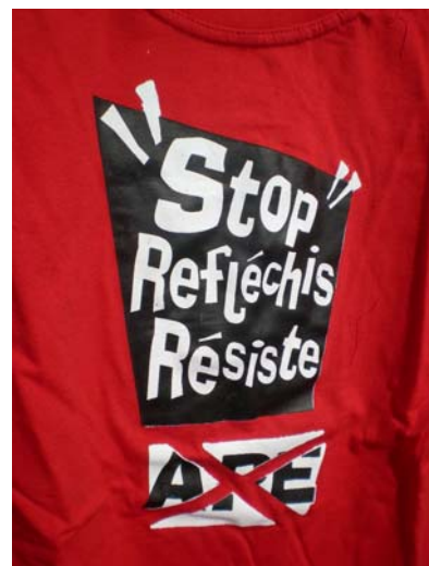
T-shirt de la Confédération paysanne du Burkina Faso

Les projets se sont déroulés comme prévu. Le suivi des projets est parfois difficile. Cela peut être dû à la situation politique sur place. Par exemple, le coup d'état en Mauritanie au mois d'août a limité des droits démocratiques et ainsi détérioré les conditions de travail du monde associatif. Un autre exemple négatif est le changement du maire de la commune de Baidiam. Le nouveau maire n'a pas les mêmes visions sur les institutions de la commune et il a mis en veilleuse les instances de concertation de la commune, mises en place par l'ancien maire – notre partenaire de longue date et garant d'un développement harmonieux et pacifique de la commune.