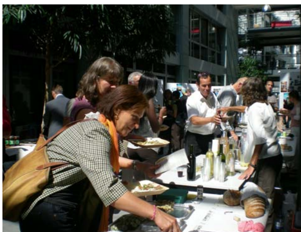
DDC à Berne : le buffet