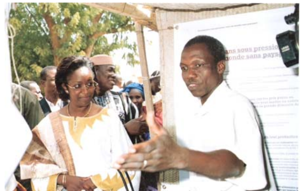
Expo paysans à la Bourse nationale des céréales à Ségou / Mali