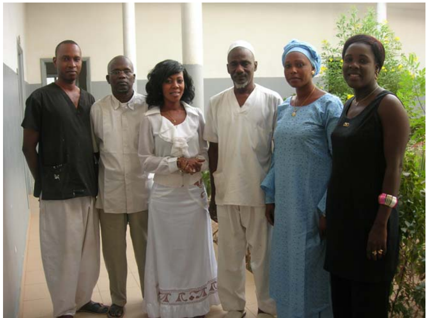
L'équipe de l'ACC à l'hôpital de Tambacounda

L'Association Clinique Councelling (ACC) formée par des travailleurs de l'hôpital de Tambacounda (Sénégal) est un centre de compétences et de formation. Ses membres s'engagent bénévolement! Elle suit régulièrement les malades et leurs familles, appuie leurs activités génératrices de revenu et oeuvre en faveur de leur dignité. L'ACC participe au Pool sida, lieu de concertation et de coordination de tous les acteurs de la région de Tambacounda. "Je constate leur grande expérience et la qualité de la relation d'accompagnement. Plusieurs membres sont engagés dans la lutte contre le sida depuis une quinzaine d'années. Les contacts avec le réseau me permettent de constater combien le travail de l'ACC est reconnu et apprécié de la part de tous." L'ACC a créé Djigui Sembe , association de personnes vivant avec le vih-sida (PVVIH) et y organise des rencontres d'échange et des repas. Un témoignage recueilli : " Je suis nouveau, je viens avec ma femme. C'est grâce à l'association qui a pris en charge les médicaments que je suis encore en vie et peux être là aujourd'hui."