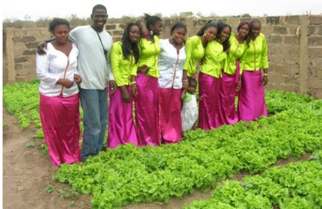
Des membres de l'UPDR/R

Cette association travaille dans les villages sous la supervision du Comité de Bakel. "La visite au village de Segou Coura m'a permis de rencontrer une équipe extrêmement motivée. Une trentaine de personnes participe à la séance et me font une