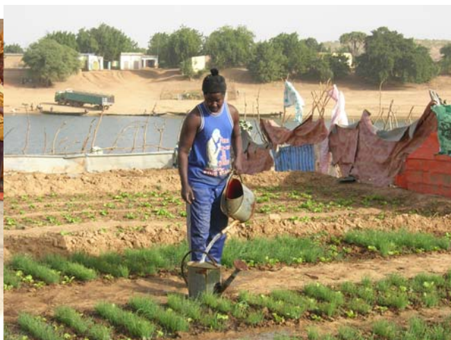
Cultures maraîchère au bord du fleuve Sénégal. Au fond, la Mauritanie